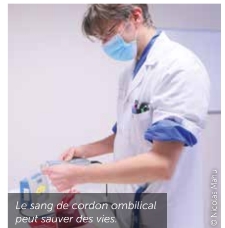
Le sang de cordon ombilical peut sauver des vies.

arbres épargnés en 1 an grâce à la formule du Poitiers Mag qui souffle ce mois-ci sa première bougie