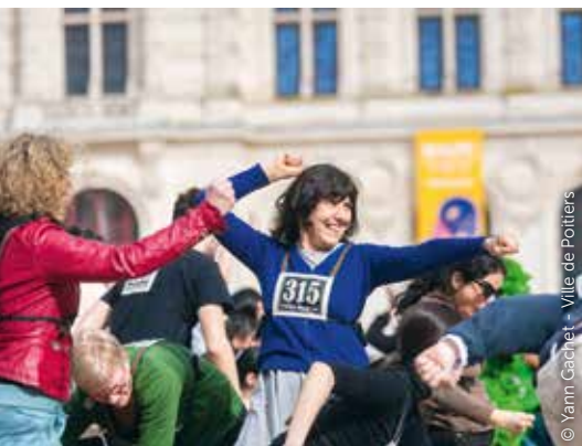
© Yann Cachet - Ville de Poitiers

Trait d'union entre monde amateur et professionnel, le festival À Corps se déroule du mercredi 3 avril au vendredi 12 avril . Une 30 e édition qui s'annonce exaltante avec de la danse à haute dose, des dialogues de corps, un joyeux mélange de formes artistiques, de générations et d'esthétiques.