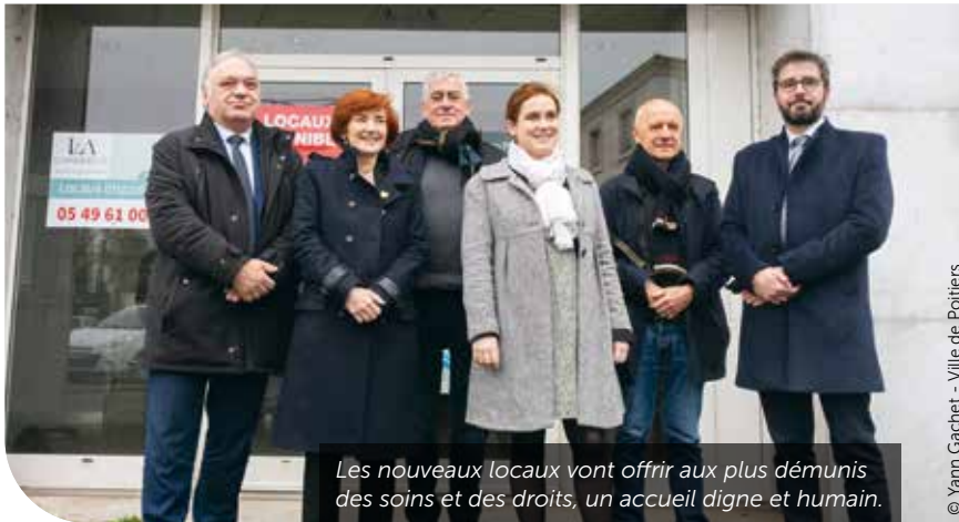
Les nouveaux locaux vont offrir aux plus démunis des soins et des droits, un accueil digne et humain.