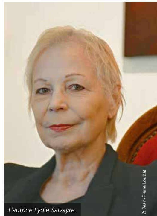
L'autrice Lydie Salvayre.