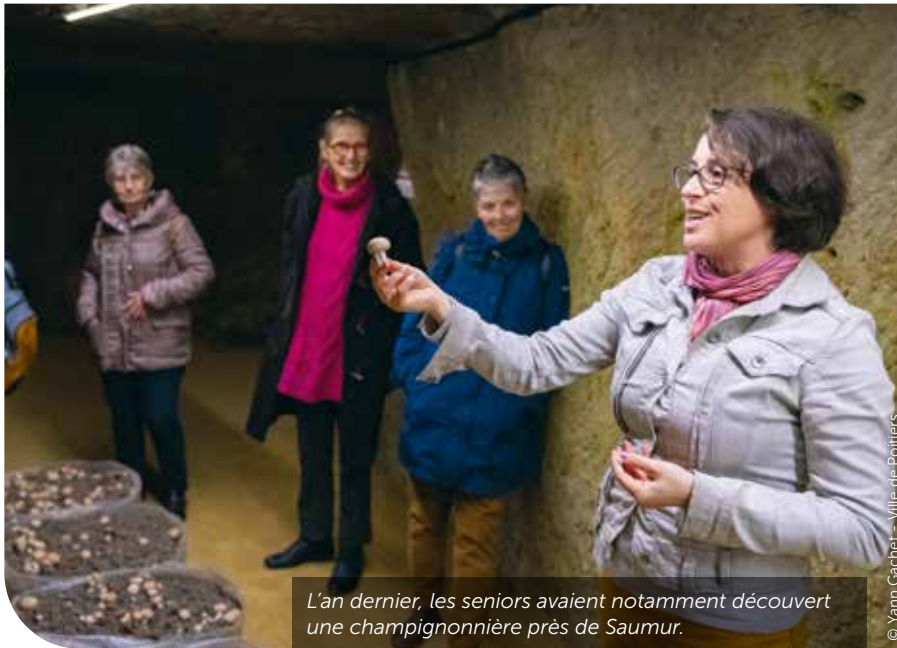
L'an dernier, les seniors avaient notamment découvert une champignonnière près de Saumur.