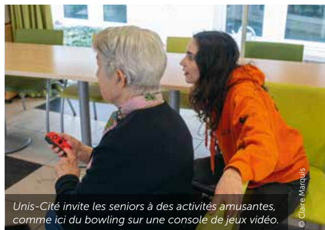
Unis-Cité invite les seniors à des activités amusantes, comme ici du bowling sur une console de jeux vidéo.