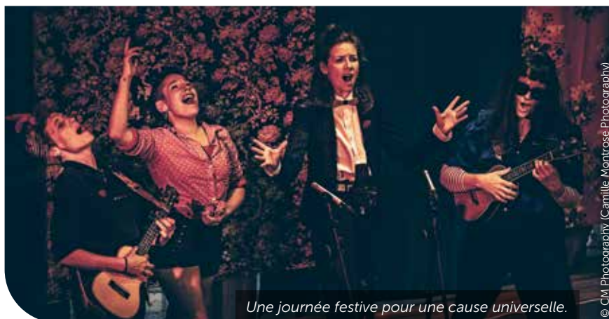
Une journée festive pour une cause universelle.