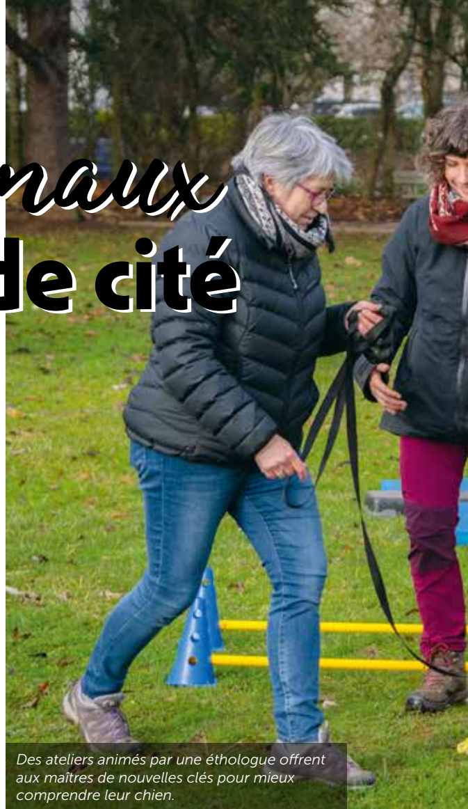
Des ateliers animés par une éthologue offrent aux maîtres de nouvelles clés pour mieux comprendre leur chien.

À Saint-Éloi, un caniparc doté d'agrès a été créé à la demande des habitants dans le cadre des budgets participatifs. Ici, ça joue, ça aboie, ça s'ébat joyeusement loin des maisons.