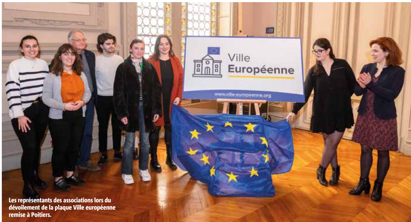
Les représentants des associations lors du dévoilement de la plaque Ville européenne remise à Poitiers.