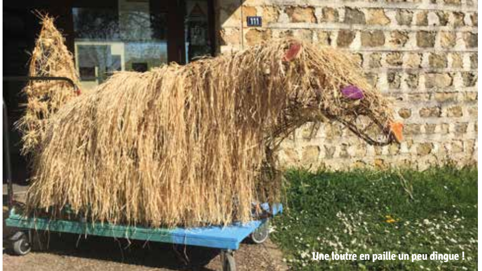
Une loutre en paille un peu dingue !