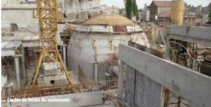
Coulée du béton du voûtement.