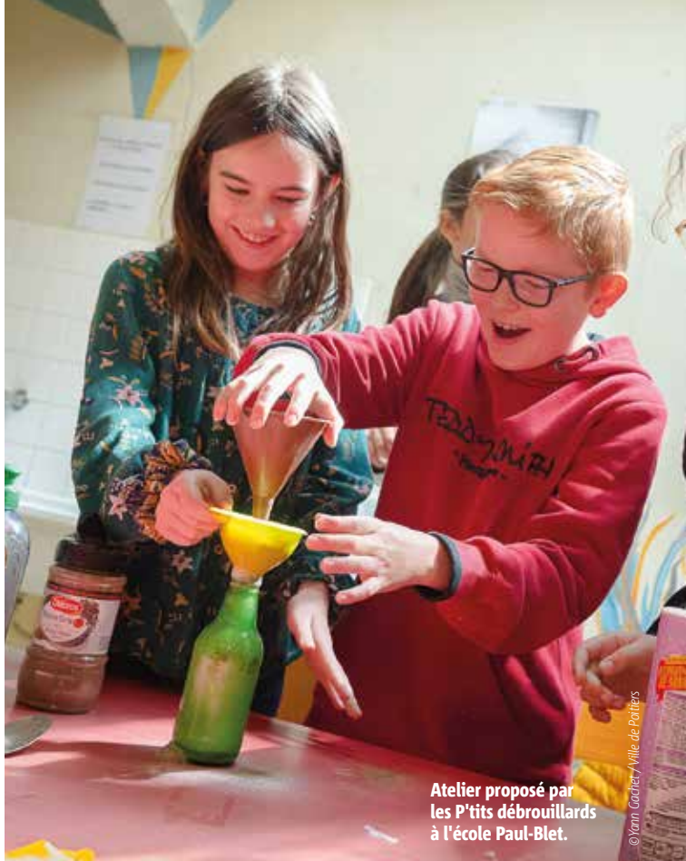
Atelier proposé par les P'tits débrouillards à l'école Paul-Blet.