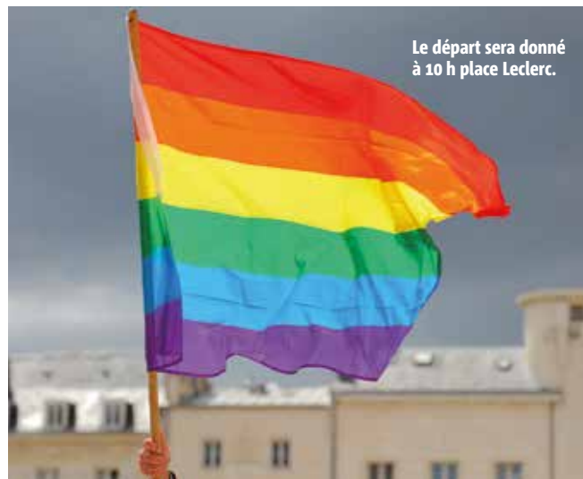
Le départ sera donné à 10 h place Leclerc.