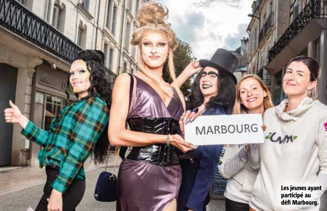
Les jeunes ayant participé au défi Marbourg.