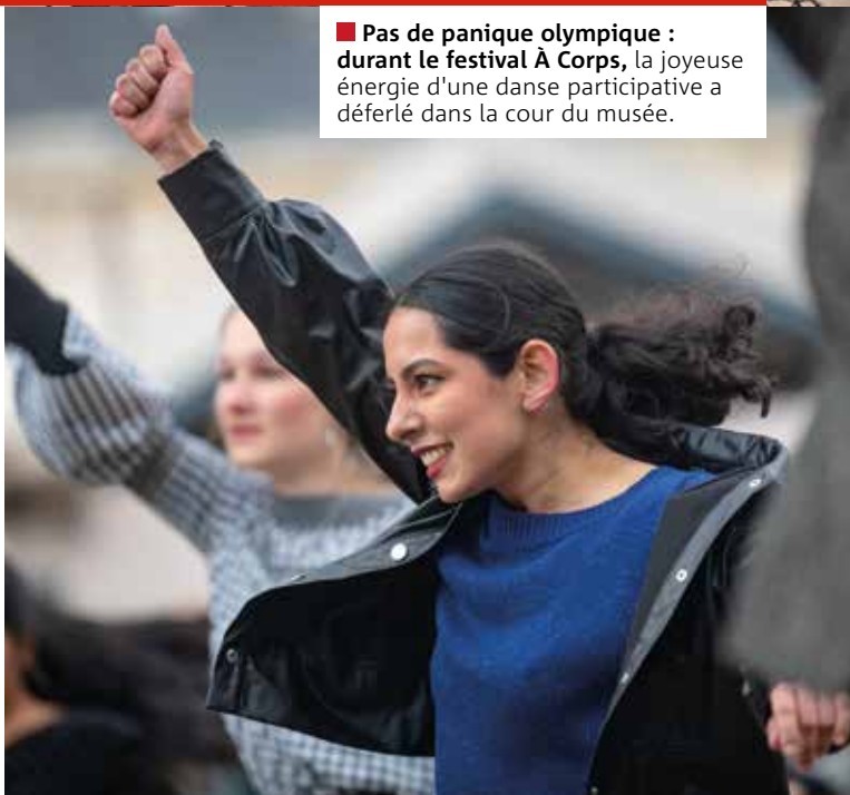
■ Pas de panique olympique : durant le festival À Corps , la joyeuse énergie d'une danse participative a déferlé dans la cour du musée.