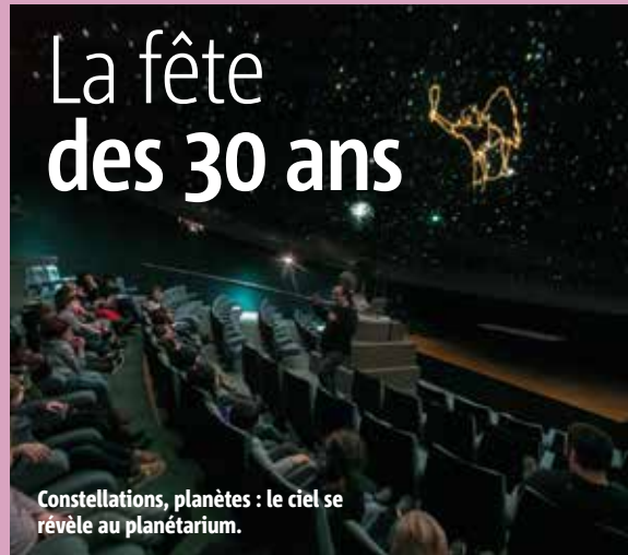
Constellations, planètes : le ciel se révèle au planétarium.