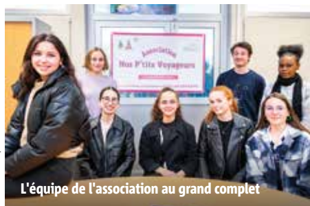
L'équipe de l'association au grand complet