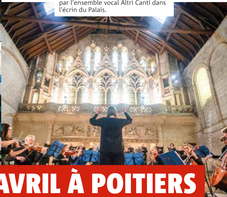
■ Magnifique Magnificat interprété par l'ensemble vocal Altri Canti dans l'écran du Palais.