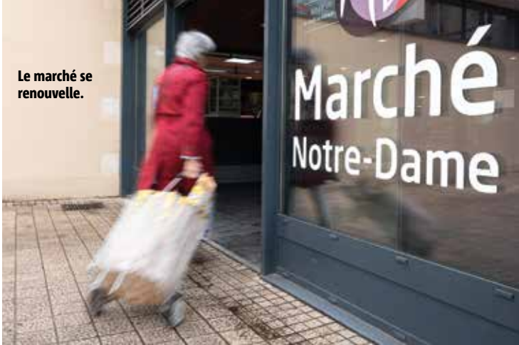
Le marché se renouvelle.