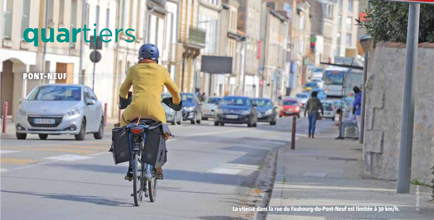
La vitesse dans la rue du Faubourg-du-Pont-Neuf est limitée à 30 km/h.