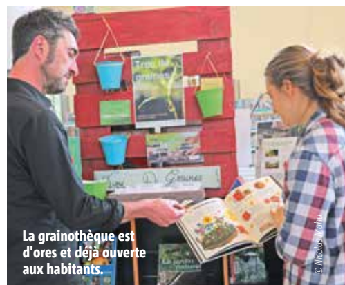
La grainothèque est d'ores et déjà ouverte aux habitants.