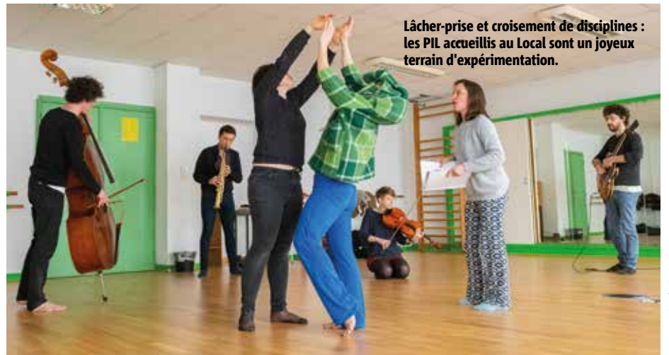
Lâcher-prise et croisement de disciplines : les PIL accueillis au Local sont un joyeux terrain d'expérimentation.