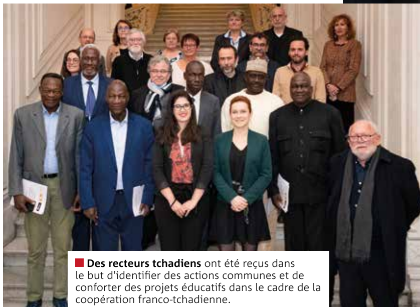
■ Des recteurs tchadiens ont été reçus dans le but d'identifier des actions communes et de conforter des projets éducatifs dans le cadre de la coopération franco-tchadienne.