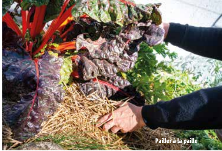
Pailler à la paille