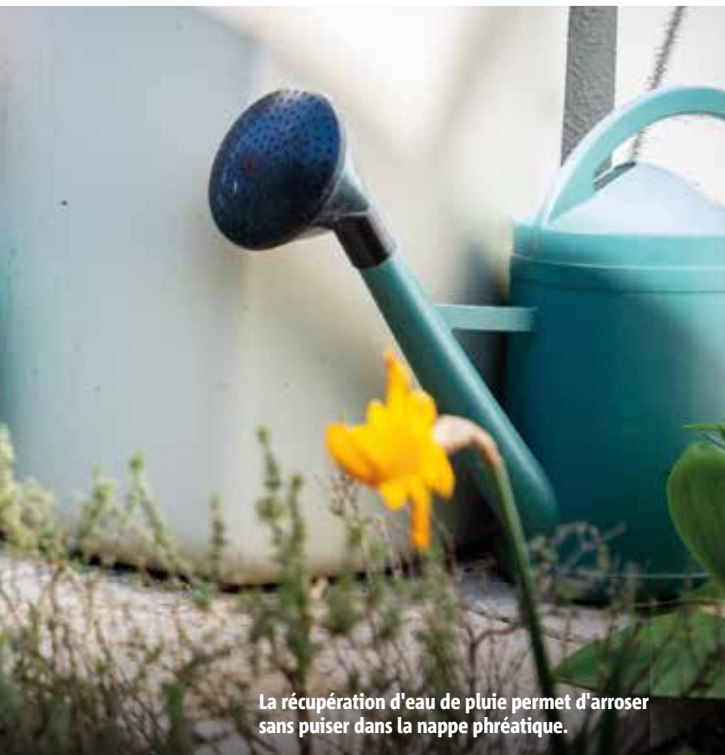
La récupération d'eau de pluie permet d'arroser sans puiser dans la nappe phréatique.