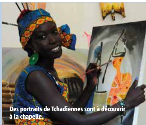
Des portraits de Tchadiennes sont à découvrir à la chapelle.

En mai, la chapelle Saint-Louis accueille trois expositions. Primo , du 6 au 15 mai, « Seconde vie », est proposée par ABOZART : installations, sculptures, photos, peintures, gravures sont réalisées à partir d'éléments récupérés et transcendés par la créativité. Vernissage jeudi 5 mai à 18h, ouvert tous les jours de 14h30 à 18h30. Secundo , du 17 mai au 29 mai, place à l'exposition du Cercle Poitevin des Arts. Les membres de l'association présentent