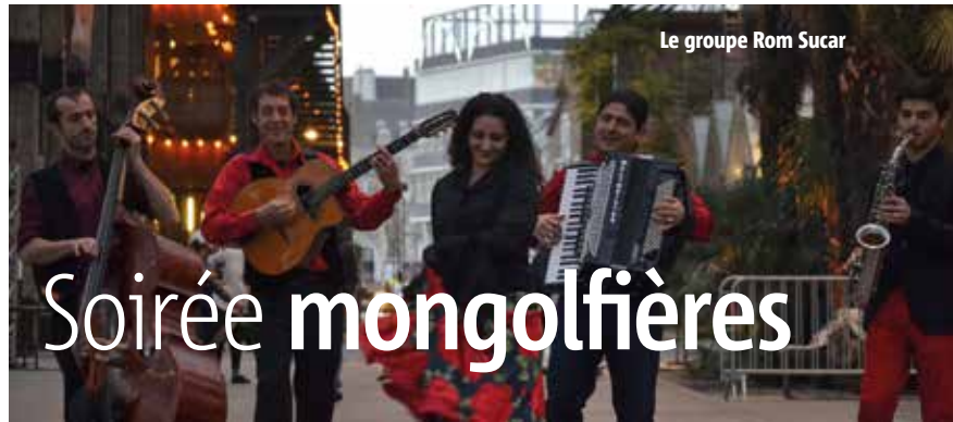
Le groupe Rom Sucar