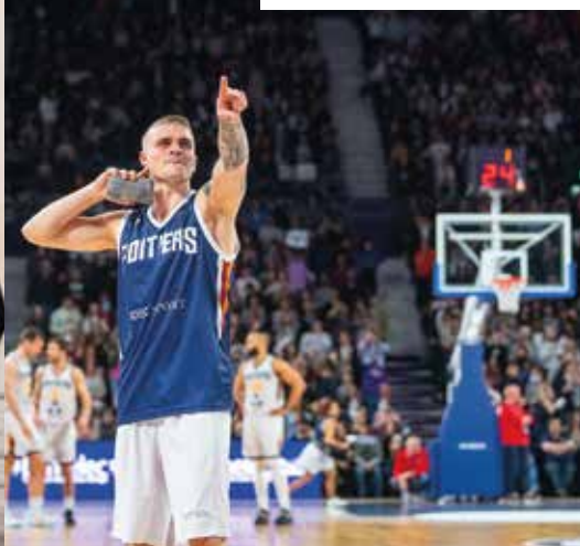
■ Pour son 1 er match à l'Arena, le PB86 a mené le match haut la main devant plus de 5 000 spectateurs.