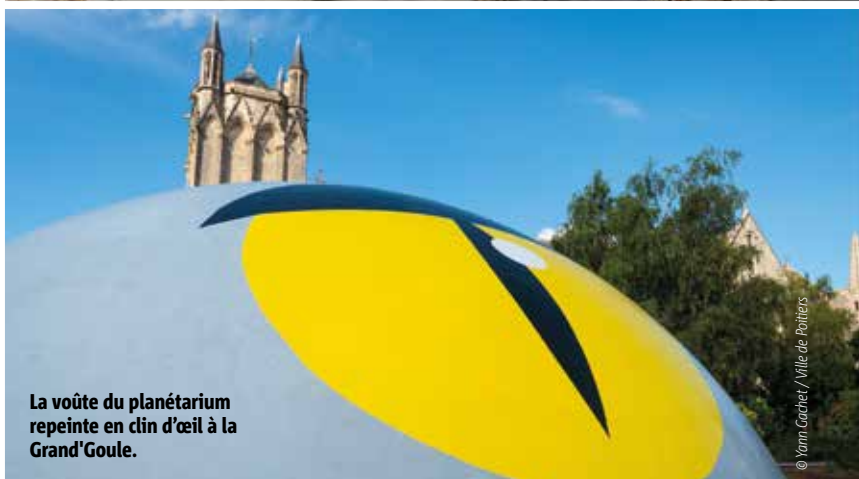
La voûte du planétarium repeinte en clin d'œil à la Grand'Goule.