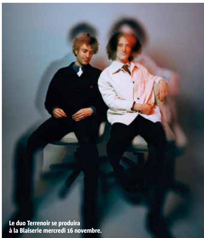
Le duo Terrenoire se produira à la Blaiserie mercredi 16 novembre.

La saison Prima la Musica du Conservatoire de Grand Poitiers démarre mardi 18 octobre avec le concert César Franck et la musique de chambre à l'auditorium Saint-Germain. Jeudi 17 novembre, l'ensemble Medida nous plonge dans les festivités musicales de la cour du roi Charles Quint.