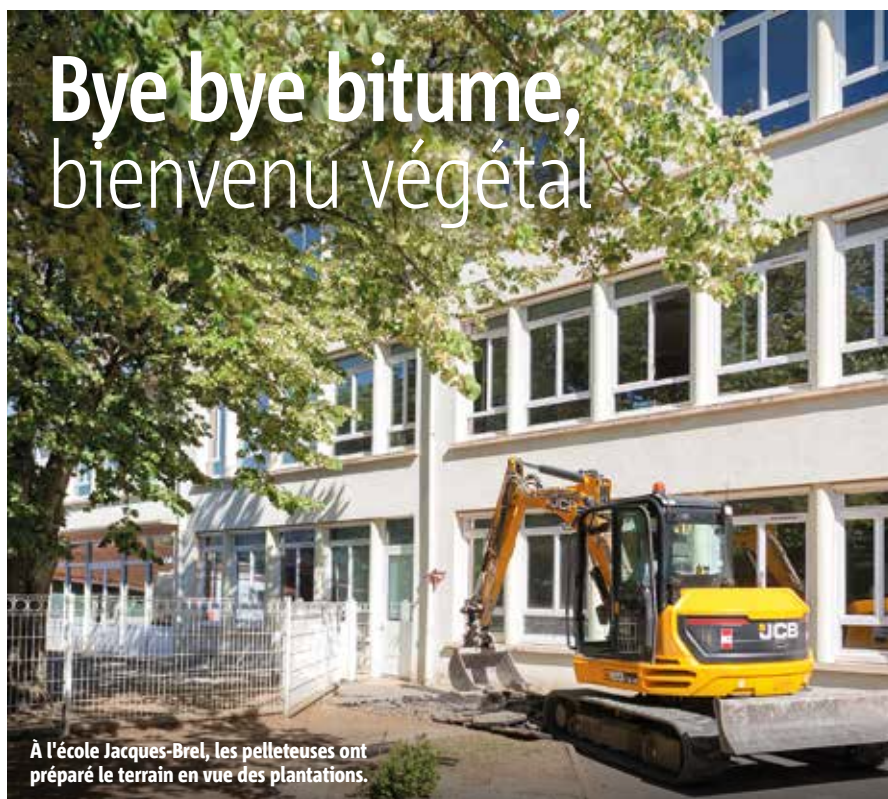
À l'école Jacques-Brel, les pelleuses ont préparé le terrain en vue des plantations.