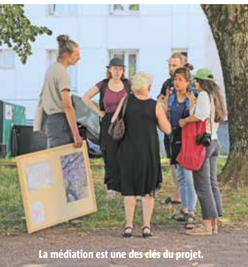
La médiation est une des clés du projet.