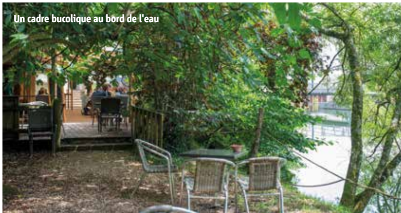
Un cadre bucolique au bord de l'eau