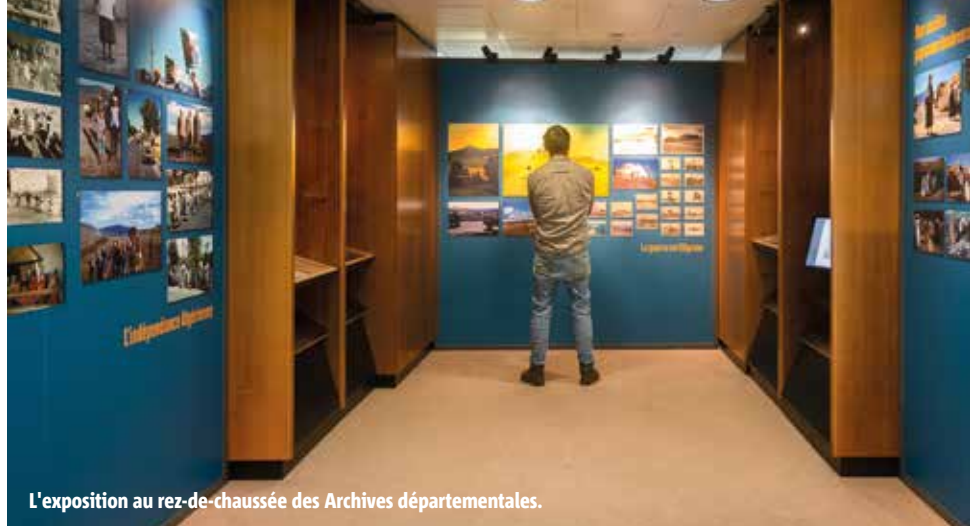
L'exposition au rez-de-chaussée des Archives départementales.