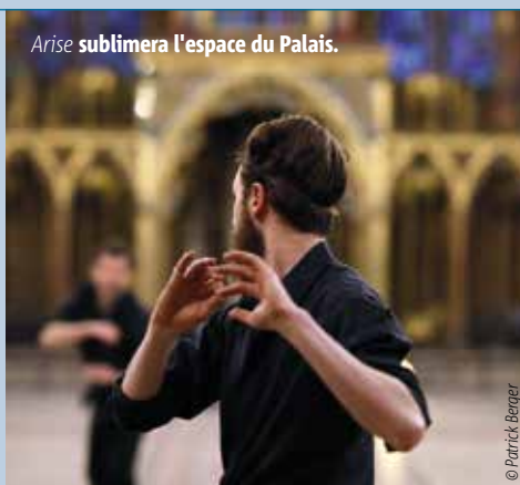
Arise sublimerait l'espace du Palais.

C'est la Sainte-Chapelle, à Paris, qui a inspiré ce projet un peu fou. Avec ses mille nuances de verre coloré, l'édifice fige le temps, ouvre l'espace et invite à s'élancer. Mieux : à léviter. C'est du moins l'interprétation qu'en font Christian et François Ben Aïm, à l'origine de la pièce chorégraphique et musicale jouée samedi 24 septembre dans un autre monument d'exception : le Palais. Performance sensible et poétique portée par la musique envoûtante (guitare-voix, piano, orgue, cordes et instruments à vent) de Piers Faccini, Arise lève le voile sur ce qu'il y a de plus vivant en chacun de nous.