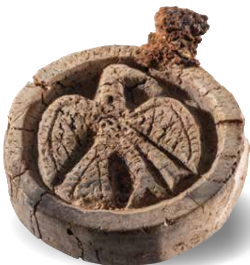
Un pion à peu plus large qu'une pièce de 2 € et figurant un oiseau.