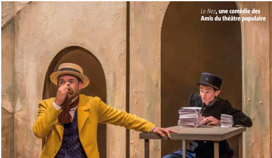
Le Nez, une comédie des Amis du théâtre populaire

LES DATES À NOTER • SAMEDI 10 ET DIMANCHE 11 SEPTEMBRE: Vienne la poésie à la Maison de la Gibauderie. Lectures rencontres avec des poètes, spectacle musical Mon Aragon de Véronique Pestel. | VENDREDI 16 SEPTEMBRE À 20H: Un Lion en hiver , au Palais. À la veille de Noël 1183, Henri II Plantagenet, roi d'Angleterre et Aliénor d'Aquitaine, se livrent à une ultime confrontation.