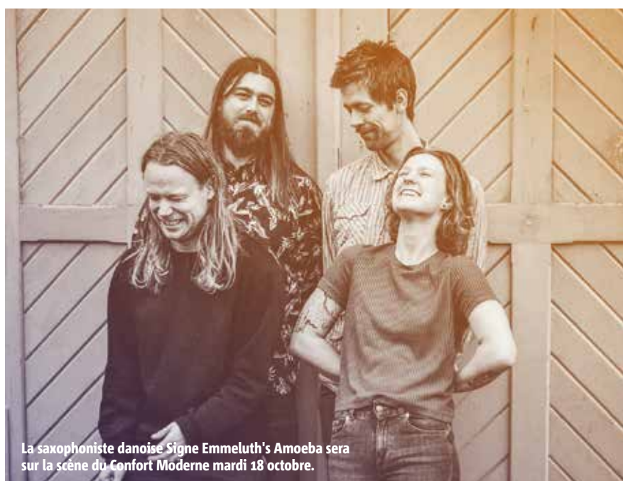
La saxophoniste danoise Signe Emmeluth's Amoeba sera sur la scène du Confort Moderne mardi 18 octobre.