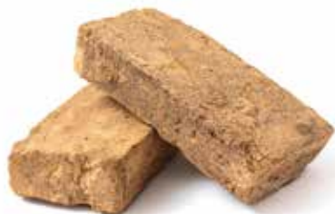
Des briques en terre crue

Le principe constructif de la plupart des murs de la future école de Montmidi peut s'apparenter à un millefeuille : sous l'enduit de chaux extérieur, des panneaux en fibre de bois compressés enveloppent une ossature bois calant des bottes de paille. Côté intérieur du bâti, une isolation en laine de chanvre et des plaques de plâtre donneront un aspect ni-vu ni-connu à un mur qui sortira clairement de l'ordinaire. Les espaces de circulation se distingueront par des briques en terre crue, fabriquées dans les Deux-Sèvres. Tous ces matériaux, biosourcés et recyclables, seront exempts de perturbateurs endocriniens. Un chantier en phase avec l'engagement de la Ville de Poitiers signataire de la charte « Ville sans perturbateurs endocriniens ».