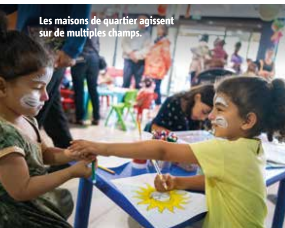
Les maisons de quartier agissent sur de multiples champs.