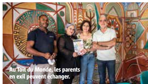
Au Toit du Monde, les parents en exil peuvent échanger.