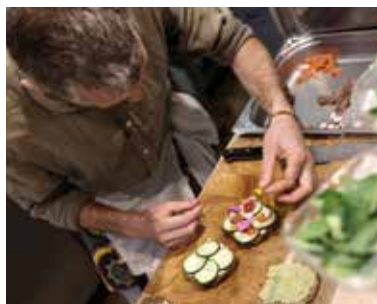
Les fameuses smørrebrød, tartines danoises garnies de divers produits frais.