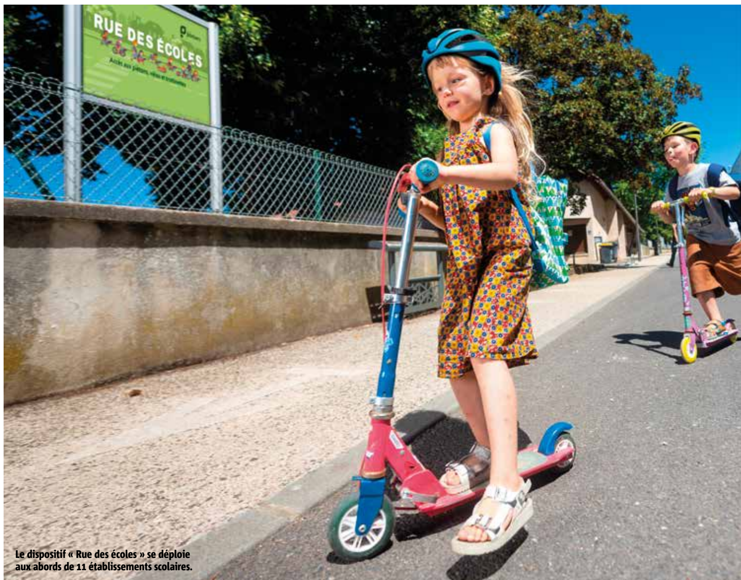
Le dispositif « Rue des écoles » se déploie aux abords de 11 établissements scolaires.

6 300 jeunes Poitevines et Poitevins retrouvent le 1 er septembre le chemin de l'école. Parce qu'on apprend mieux en travaillant dans de bonnes conditions, la Ville de Poitiers s'engage pour l'épanouissement des enfants. Dispositifs d'écomobilité, équipements rénovés, nouvelles activités périscolaires, végétalisation des cours d'écoles... À Poitiers, la rentrée est ponctuée de nouveautés. État des lieux.