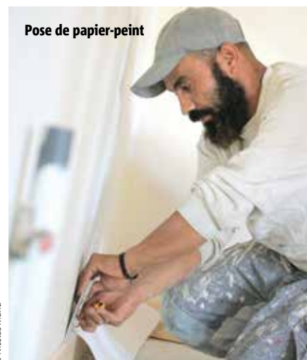
Pose de papier-peint