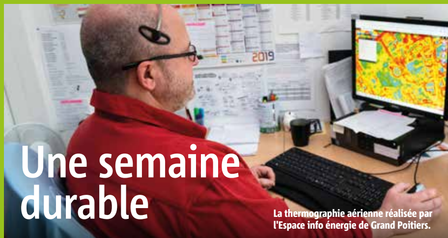
La thermographie aérienne réalisée par l'Espace info énergie de Grand Poitiers.

D'autres espaces sont consacrés à la réduction des déchets, au travail ou encore à la résistance, celui-ci réunissant des acteurs comme Greenpeace Poitiers, Extinction rébellion, la Ligue des droits de l'homme ou encore Bassines, non merci. Il proposera par exemple des ateliers de désobéissance civile.