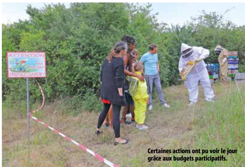
Certaines actions ont pu voir le jour grâce aux budgets participatifs.