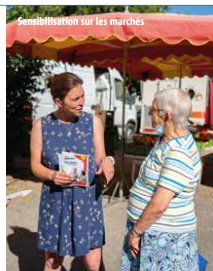
Sensibilisation sur les marchés

Vendredi 9 septembre sur le marché de Bel-Air et mercredi 14 septembre sur le marché de Montmidi.